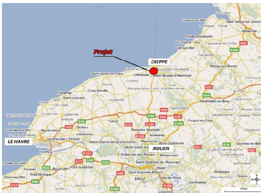
Plan de situation à l'échelle de l'Agglomération Dieppe Maritime